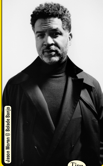
Jason Moran