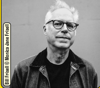
Bill Frisell

Die 50. Leipziger Jazztage (17.–24. Oktober) werfen ihre Schatten voraus und die ersten Tickets sind bereits im Umlauf: Seit Juni läuft der exklusive PreSale für das Konzert von Jason Moran in der Thomaskirche (21. Oktober). Der US-amerikanische Pianist und Konzeptkünstler gehört zu den prägendsten Stimmen des zeitgenössischen Jazz. In Leipzig widmet er sich mit »Jason Moran Plays Duke Ellington« dem