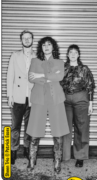
Sheen Trio