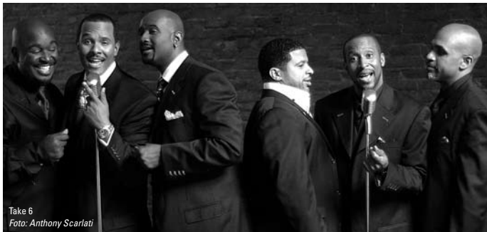
Take 6

Diese Festtage der Vokalmusik sind im Frühjahr zum alljährlichen Anziehungspunkt für erstrangige Formationen aus aller Welt geworden. Mittlerweile ist a cappella als ein Markenzeichen einer sich erneuernden, lebendigen Musikstadt Leipzig mit stetig wachsendem Publikumszuspruch anzusehen.