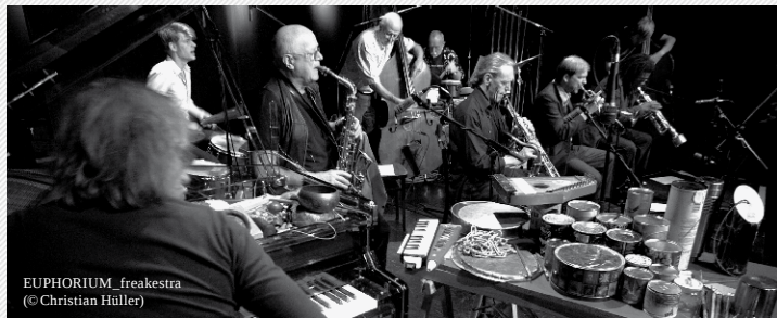
EUPHORIUM_freakestra