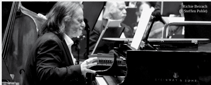
Richie Beirach

Do 8. Dezember // Liveclub Telegraph // 21 Uhr // Jazzclub-Leipzig-Konzert